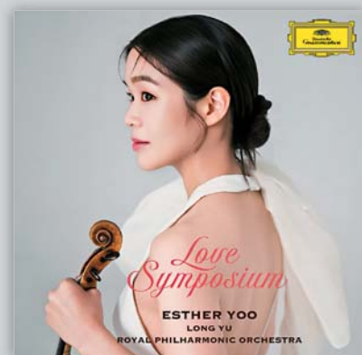
▲《Love Symposium》是Esther認為「最個人」的一張專輯。

「愛」這主題，在創作世界裏，幾乎被說到不能再說。於是，我們會問：還可以說甚麼？Esther Yoo 選擇再說一次——但她沒有給答案，只是把話題說得更誠實一點。十六歲在西貝流士國際小提琴大賽得獎，她很早已進入主流視野。之後與頂尖樂團、指揮合作，錄音以協奏曲為主，一切都很「正確」。但《Love Symposium》，明顯不是這一種正確。