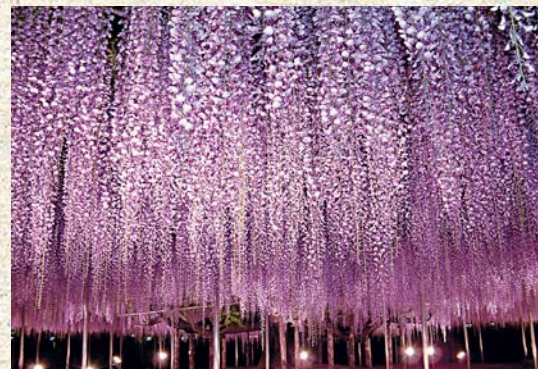
▲紫色花朵在夜色中透出晶瑩剔透的質感。

栃木縣的足利花卉公園被譽為「世界最美的藤花景點」，園內最引人入勝莫過於樹齡超過一百六十年的「大藤」。在廣達逾千平方米的棚架上，數以萬計的紫色花穗如瀑布般垂掛而下，長度可達一點八米。除了經典的深紫色大藤，園中還可找到長八十米的白藤隧道與稀有的黃花藤，不同色澤交織出如夢似幻的隧道，讓人彷彿置身於《阿凡達》世界。