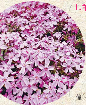
▲芝櫻並非櫻花，而是一種開在地面上的繡球花。