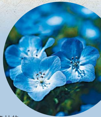
▲粉蝶花在日本又稱「琉璃唐草」。