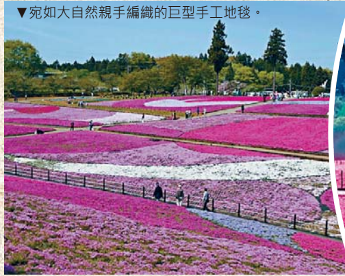
▼宛如大自然親手編織的巨型手工地毯。

除了花海，羊山公園正如其名，園內設有「綿羊牧場」，遊客可以近距離觀察可愛的綿羊，為賞花行程增添一份溫馨的牧場風情。