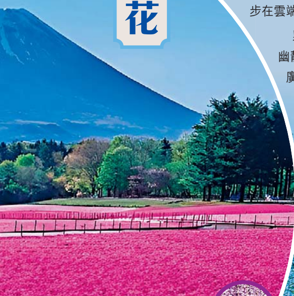
▲滿開的芝櫻加上富士山背景，非常夢幻。