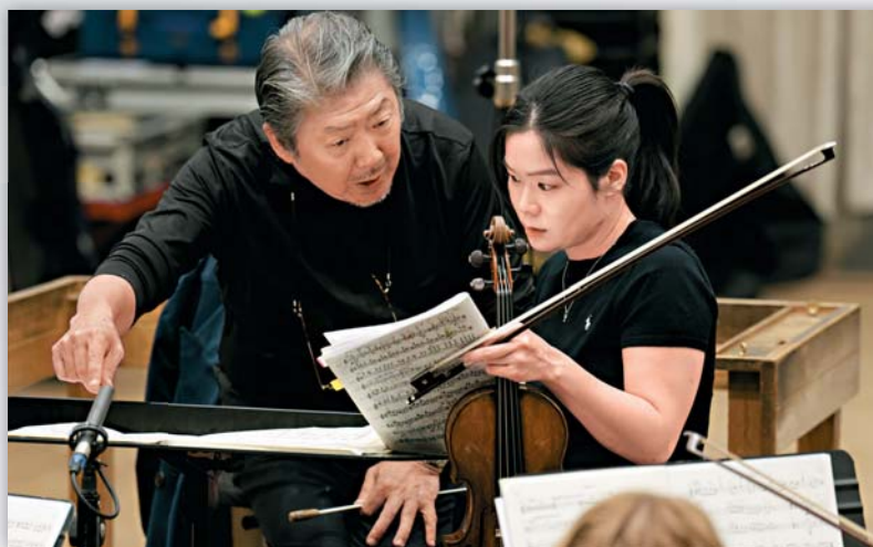
▲專輯影拍指揮家余隆（圖左）和 Royal Philharmonic Orchestra，演繹多首與「愛」相關的樂曲。

望大家帶走甚麼？她想了一下。「也許，是去思考自己生命中的愛。」有些音樂，是讓你記住旋律。有些，是讓你記住演奏者。而有一些——是讓你開始看到自己。