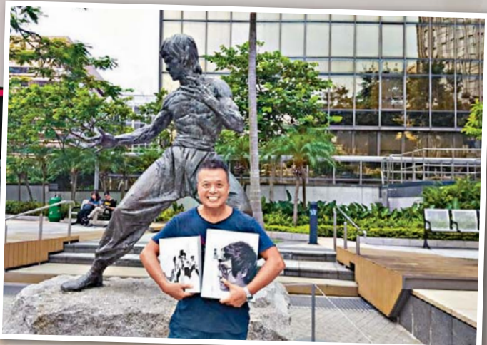
▲紀念李小龍的《龍影中華》和《龍影香江》，深得「龍迷」喜愛。