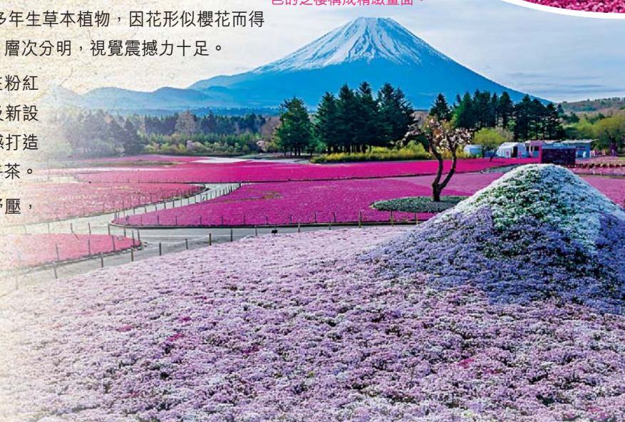
▼濃粉、桃紅、純白及淡紫色的芝櫻構成精緻畫面。

會場設有須收費的「展望足湯」，讓遊客能一邊泡腳舒壓，一邊眺望富士山與繽紛花海，是視覺與觸覺的雙重享受。