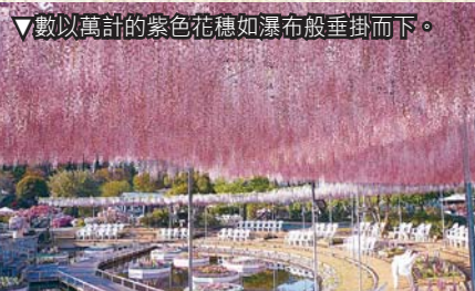
▼數以萬計的紫色花穗如瀑布般垂掛而下。

日本一年四季氣候分明，儘管賞櫻高峰期已過，踏入初夏仍不乏賞花好去處，單計東京近郊地區，便已有多個能細賞花卉絕景的人氣熱點，讓你置身由芝櫻、粉蝶花、紫藤花等構成的壯麗花海盡情打卡。儘管開到荼蘼花事了，大家仍可用眼睛游走於花天花地世界。