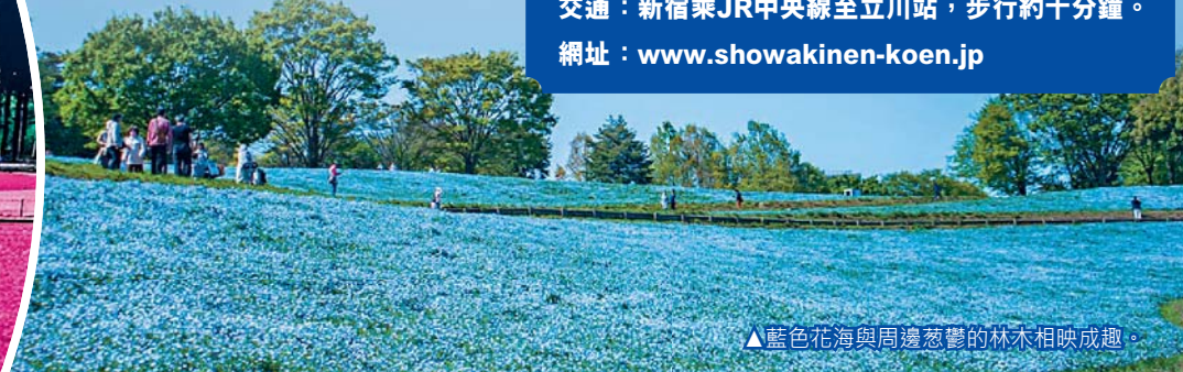
▲藍色花海與周邊蔥鬱的林木相映成趣。